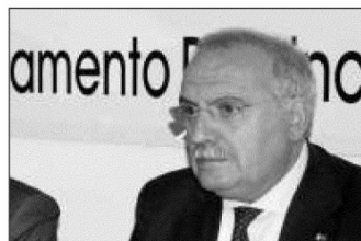
PD Ludovico Vico