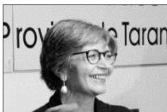
PD Anna Finocchiaro