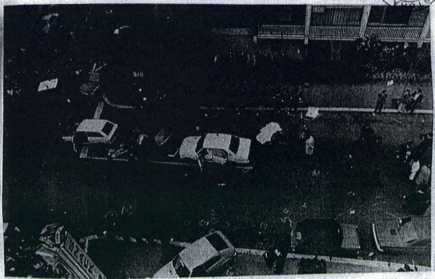
4) - altra panoramica dello stesso tratto di via Mario Fani ripresa dall'alto con visione della Fiat 128 familiare, della Fiat 130 e dell'Alfetta con a bordo i cadaveri del personale di scorta;