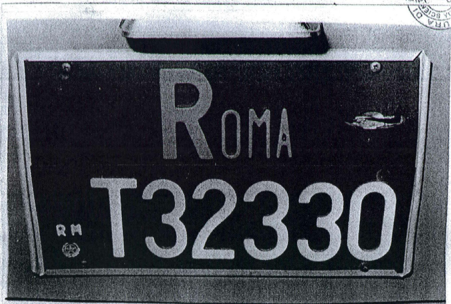
136) - particolare del foro nella targa posteriore della Mini;